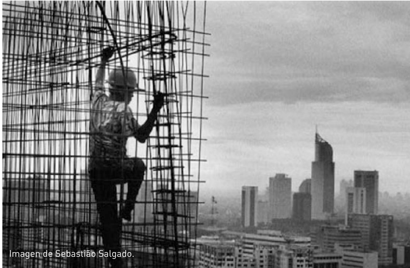
Imagen de Sebastião Salgado.