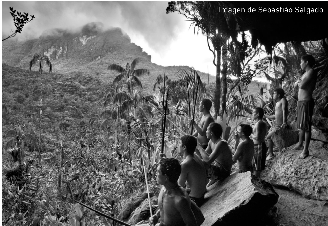
Imagen de Sebastião Salgado.