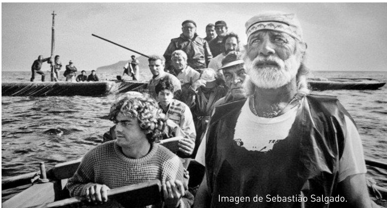
Imagen de Sebastião Salgado.

Dos reflejos de un sistema globalizado que sitúa y ensalza el crecimiento económico, el control de los recursos y las zonas geoestratégicas del planeta en el centro de las agendas, y que priva a las personas y a los ecosistemas de sus derechos más fundamentales para vivir.